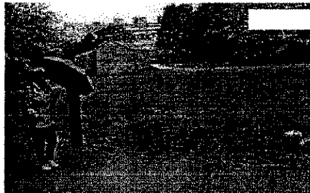
Terrenos del parque fluvial que el TSXG declaró "usurpados".